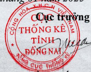
Trần Quốc Tuấn